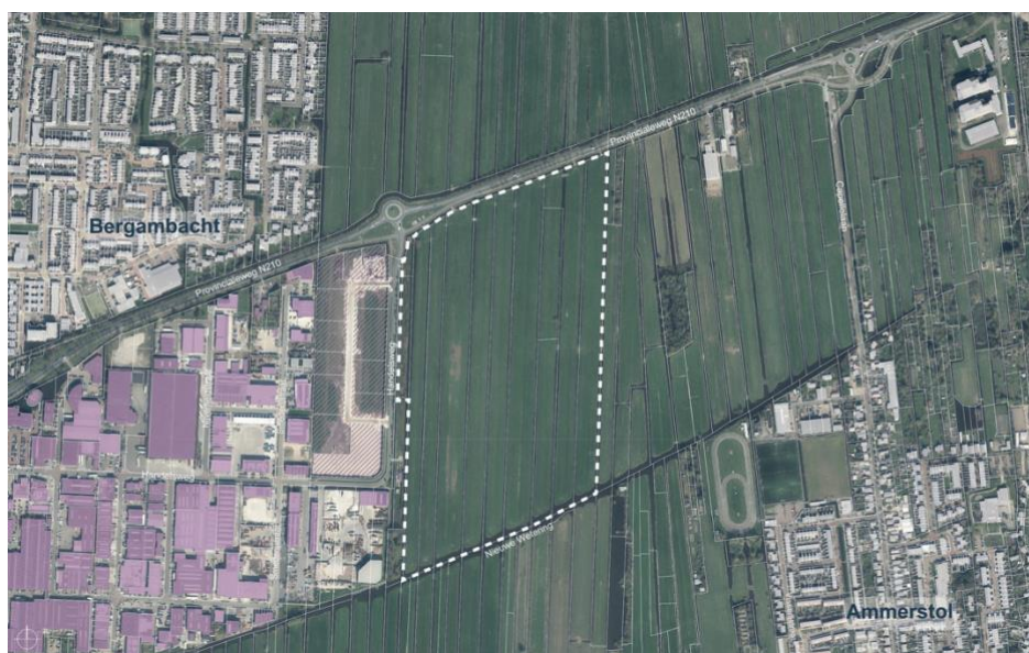
Figuur 1. Projectgebied De Nieuwe Wetering V

Binnen de gemeente Krimpenerwaard is er behoefte aan nieuwe bedrijfskavels. De bestaande mogelijkheden binnen de gemeente zijn nagenoeg volgebouwd en de vraag naar nieuwe bedrijfskavels is groot. Niet alleen voor de vestiging van nieuwe bedrijven of de uitbreiding van bestaande bedrijven, maar juist ook voor het verplaatsen van bedrijven uit de kernen. Om zo eventuele overlast te verminderen en ruimte te maken voor andere functies, waaronder wonen. Er ligt nu een plan om het bedrijventerrein De Nieuwe Wetering in Bergambacht aan de oostzijde uit te breiden. In de afgelopen periode heeft Ontwikkelaar Immoned Vastgoed Ontwikkeling BV het bedrijventerrein Nieuwe Wetering IV ontwikkeld. In overleg met de gemeente Krimpenerwaard en Immoned Vastgoed Ontwikkeling is daarop een aanvulling te ontwikkelen: Nieuwe Wetering V , gelegen aan de Handelsweg. Op 9 juli jl. hebben de gemeente Krimpenerwaard en Immoned Vastgoed Ontwikkeling een intentieovereenkomst getekend om de haalbaarheid voor deze uitbreiding te onderzoeken. Als het haalbaarheidsonderzoek met een positief resultaat kan worden afgesloten, dan is het aan de gemeenteraad om te besluiten of dit project een vervolg krijgt en welke randvoorwaarden de uitwerking van dit plan mee krijgen.